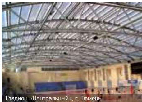
Стадион «Центральный», г. Тюмень