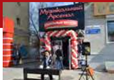
Волгоград Население: 1 017 985 человек