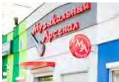
Калининград Население: 448 548 человек