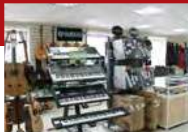
Пермь Население: 1 026 477 человек