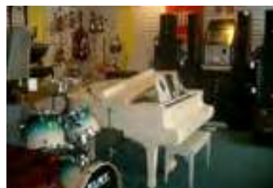
Сургут Население: 332 313 человек