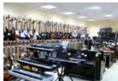
Краснодар Население: 805 680 человек