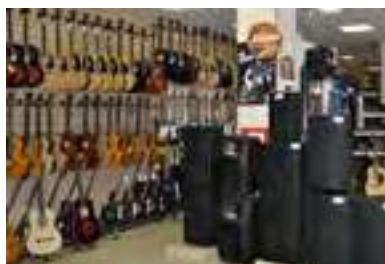
Казань Население: 1 190 850 человек