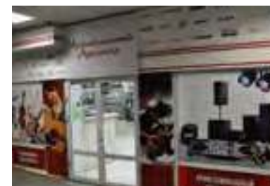
Красноярск Население: 1 035 528 человек