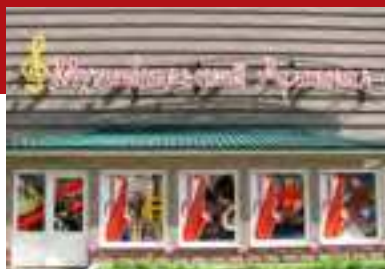
Барнаул Население: 632 848 человек