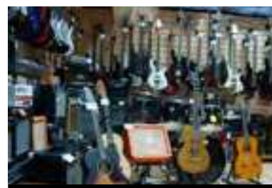
Нижний Новгород Население: 1 263 873 человек