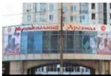
Липецк Население: 509 719 человек