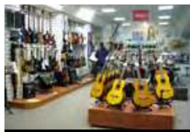
Уфа Население: 1 096 702 человек