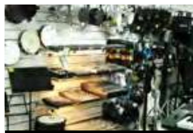
Челябинск Население: 1 169 982 человек