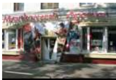
Улан-Удэ Население: 421 453 человек