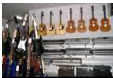
Курган Население: 333 640 человек