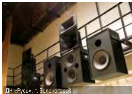
ДК «Русь», г. Зеленогорск