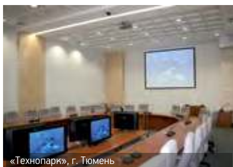
«Технопарк», г. Тюмень