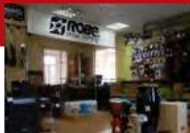
Псков Население: 206 730 человек