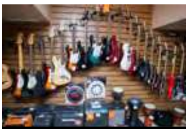
Тюмень Население: 679 861 человек