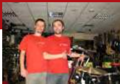
Белгород Население: 379 508 человек