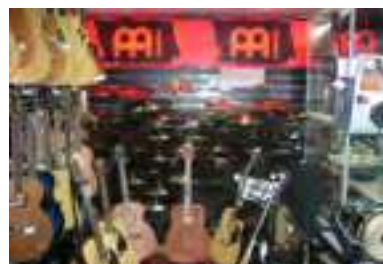
Кемерово Население: 544 006 человек