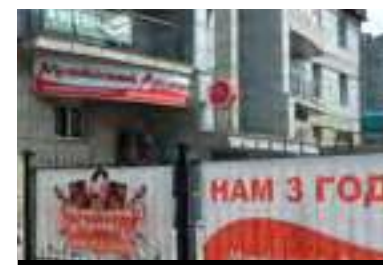
Новокузнецк Население: 550 213 человек