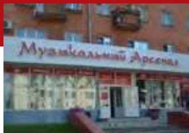
Омск Население: 1 166 092 человек