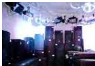
Томск Население: 557 179 человек