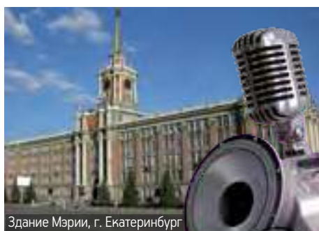
Здание Мэрии, г. Екатеринбург