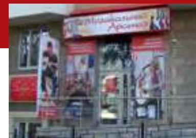
Екатеринбург Население: 1 412 346 человек