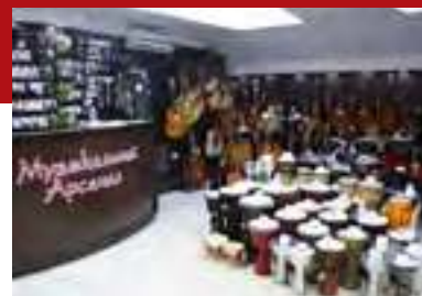
Воронеж Население: 1 014 610 человек