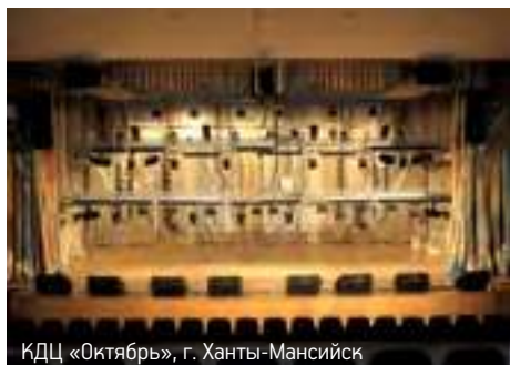
КДЦ «Октябрь», г. Ханты-Мансийск