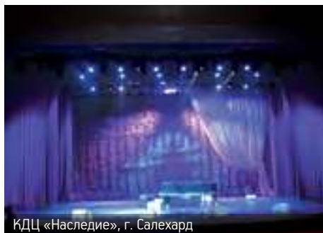
КДЦ «Наследие», г. Салехард