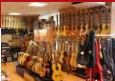
Новосибирск Население: 1 547 910 человек